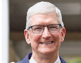
Tim Cook, CEO

Apple CEO Tim Cook said its flagship iPhones sold in the US for the June quarter will be predominantly made in India, where the smartphone-maker reported record first quarter earnings, prompting it to open more stores.